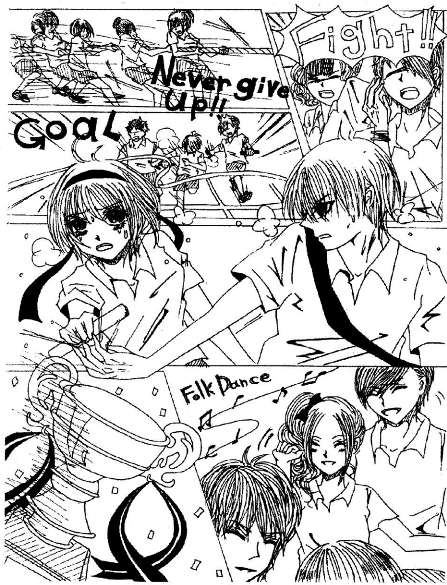
(表紙デザイン：大原稚早都)