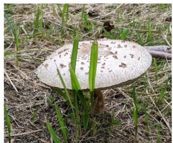
カサが20cm ぐらいのキノコ

校内の工事ではエアコンの工事も完了し、すべての教室のエアコンが新しくなりました。また、ゴミ捨て場の場所が変わりましたので、注意をしてください。児童ホームの工事は2学期中に終わる予定です。夏休みの工事中に大きなアシナガバチの巣が見つかり、教頭先生に駆除してもらいました。休み中の学校では色々なことがありましたが、皆さんの夏休みはどうだったでしょうか。