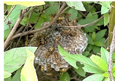
20cm ぐらいのハチの巣