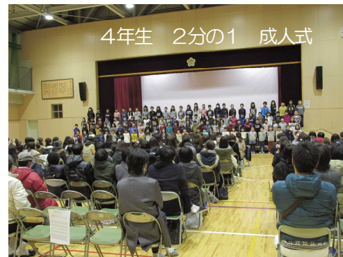
4年生 2分の1 成人式

男子フィギュアのけがを乗り越えての羽生選手の2連覇をはじめ、今回の平昌オリンピックでの連日の日本選手の活躍、心が躍ったのではないのでしょうか。金メダル確実と言われ、大変なプレッシャーの中、その通りに金メダルを取る、何というメンタルの強さでしょうか。選手の皆さんのあきらめない姿とメンタルの強さが際立った大会となりました。オリンピックも終わり、心と気がつくとはや3月。運動場の梅の木には花がつき始めました。