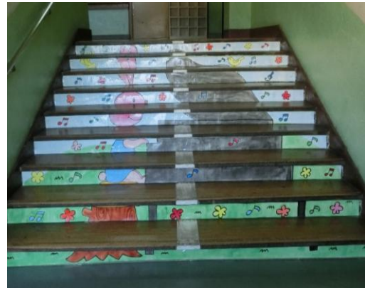
音楽会の準備も進んでいます。