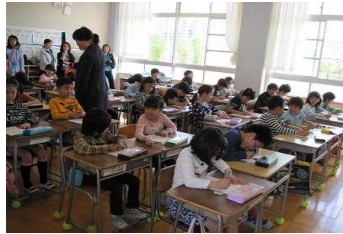
(4月の授業参観にて)

早いものでもう5月を迎えようとしています。学校では、卒業式や入学式という大きな節目となる行事を経て、いよいよ本格的な学校生活が軌道に乗ってきました。新1年生も少しずつですが、学校にも慣れ勉強や休み時間等には、とても活発に活動することができるようになってきました。