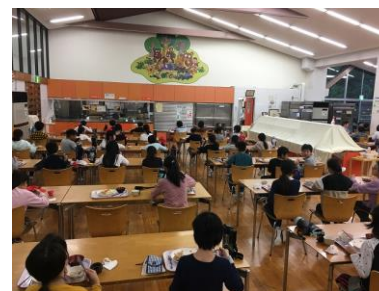
みんな同じ方を向いて、夕食。ちょっと寂しいですね。