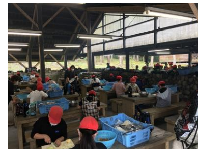
自分たちのお昼ご飯をかけて、みんな一生懸命作りました。