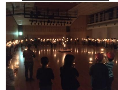
みんなでろうそくを持って、少年自然の家での活動のしめくくり。