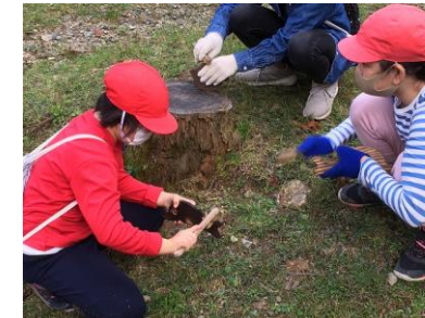
稲刈りが終わるとその足で、野外炊事場で、焼き板けずり。