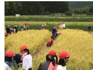
鎌を使って手で稲刈り。ていねいにがんばりました。