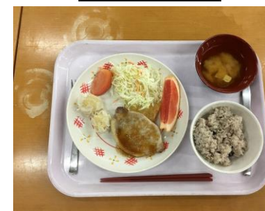
時間のない中、しっかりおかわりをしていました。

※写真が見えにくいかもしれませんが、校門や校長室前に次号掲示までカラー版を掲示しますので、ご来校の機会にご覧ください。