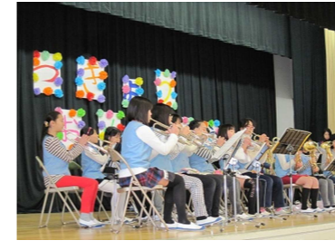
(6年生を送る会での演奏)

2月5日(土)、あましんアルカイックホールにて「定期演奏会」が開催されました。潮小学校からは金管バンドの皆さんが出演し「にじいろ」と「情熱大陸」を披露しました。6年生の皆さんにとっては、小学校生活最後の演奏会となりました。会場は、友だちや保護者の皆様、そして、一般鑑賞の方々でほぼ満員となり緊張感もありましたが、見事な演奏で有終の美を飾りました。すばらしい演奏会でした。