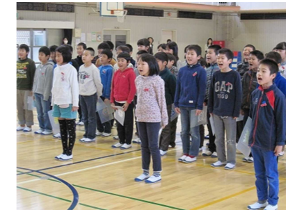
(各学年からのお祝いです)