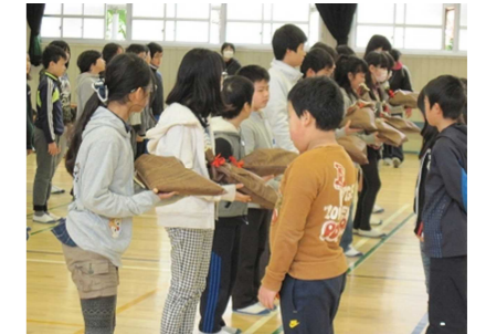
(最後に6年生からのプレゼントです)