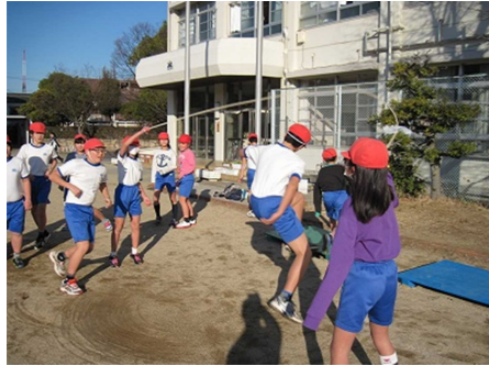
(なわとびタイムに励む子どもたち)

春の陽光を感じる3月。寒さも少しずつ和らぎ、日ざしもだんだんと暖くなり、春の訪れが感じられるような季節となりました。早いもので、平成27年度もあと残すところ1ヶ月となりました。保護者の皆様や地域の方々、子どもたちにとってどんな一年だったでしょうか。先日は「6年生を送る会」が終わり、この2日と4日には、今年度最後の参観・懇談会が行われます。卒業式、修了式まで残された日はわずかですが、子どもたちは、今年のとまとめと来年度への準備に懸命に取り組んでいます。