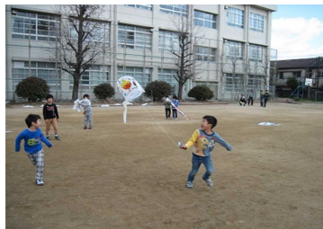
(たこあげを楽しむ1年生)