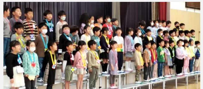
お礼の言葉を伝える1年生