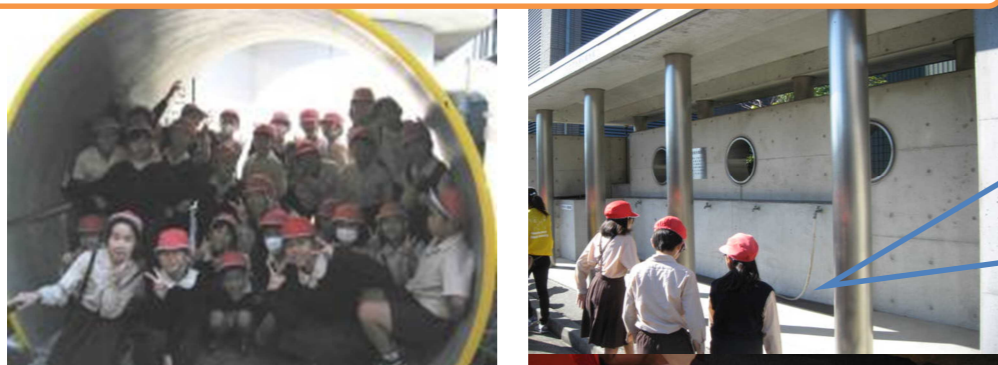
11/4(水) 4年生 社会見学(尼崎浄水場)

自分たちがふだん当たり前のように使っている水が、どのようにしてつくられているのか学んできました。非常用の水もたくさん準備されていることを知り、びっくりしました。