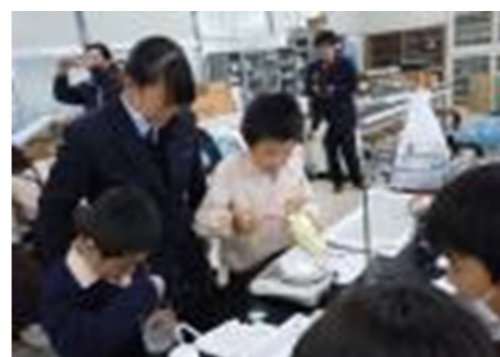
11/26(木)3・4年生 小高連携(尼崎小田高校サイエンス科による授業)

清和小では、準備や後片付けも学習のうち、と児童がします。先生方のお道具などの荷物運びも、児童が手分けして行い、6年全員で門まで先生方を見送りに行きました。