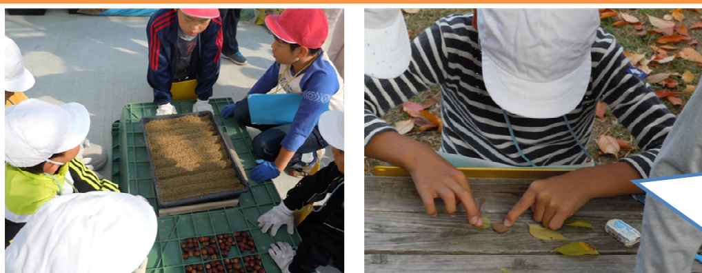
11/6(金) 3年生 環境体験学習(あまがさきの森中央緑地)

どんぐりのたねを植えたり、大きくなったどんぐりを植え替えたりしたよ。「大きなあれ!」10円玉がピカピカになるふしぎな葉っぱも発見したよ♪自然の力って偉大☆