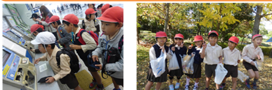
11/20(金) 1・2年生 社会見学(上坂部西公園)

自分たちだけで切符を買って、ときどきながら上坂部西公園までたどりつきました!!秋みつけや、グループ遊びも楽しかったよ♪