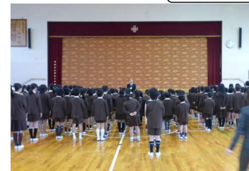
平成27年度1学期始業式

校時表は3種類あります。 通常は校時表 A 校時表 B(掃除のない日) 校時表 C(給食のない日) となります。