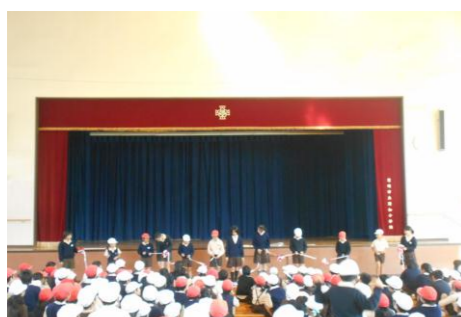
12/2(金) 新体育館オープン

耐震化の工事がようやく終わり、みんなが気持ちよく新しい体育館を使うことができるように、5年生全員で一生懸命に掃除をしました。 これでピカピカになった体育館で体育ができますね。5年生、ありがとうございます!