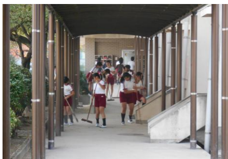
12/1(木) 5年生 新体育館清掃