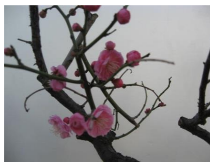
校歌に歌われる校庭の梅が芽吹き始めました

一月に入り、放送委員会が時々今月の歌を流してくれます。今月は「たきび」です。こんな風物詩は最近とんと見なくなりました『垣根の垣根の曲がりかど…』。落ち葉炊きなど子どもたちは知っているのでしょうか。