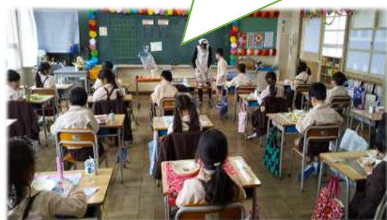
【1年生初めての給食はハヤシライス】

いっぱい食べたよ。おかわりもしたよ。 マスクをはずすときはしずかにして食べたよ。