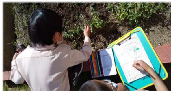
【3年生むしめがねをもって外で虫をさがしたよ】

理科の勉強で虫さがしをしたよ。 「ここにいた!」 「あれ、この花はなんだろう。」