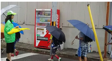
【尼信さんの見守り】