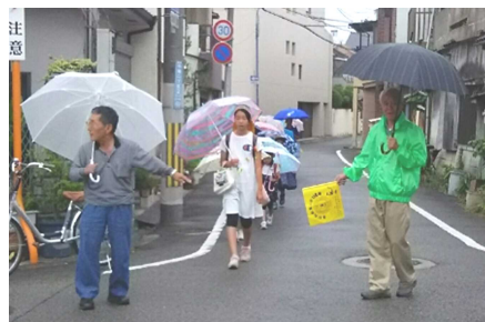
【地域の方に守られて…→】