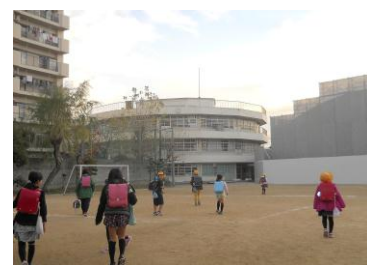
防音シートで覆われた体育館と円形校舎