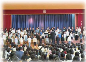
写真は校内発表会

アルカイクホールで行われた小学校音楽会に、4年生が出演しました。代表として、堂々と歌いることができました。