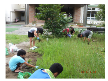
さすがは、お父さん！黙々掃除！！手ごわい芝をどんどん抜いてくださいました。