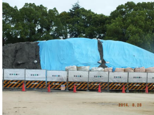
運動場に地面を掘り起こした残土が9月中旬まで残ります。