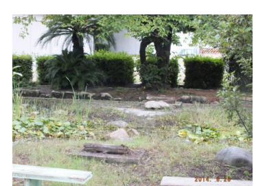
途中から6年生の男の子が参加しました。2時間も草引きをがんばったので、大きなビニル袋が20個ほどに・・・。ビオトープは、すっきりきれいになりました。そして、水中にはエビや小さい魚、オタマジャクシ等が泳いでいました。