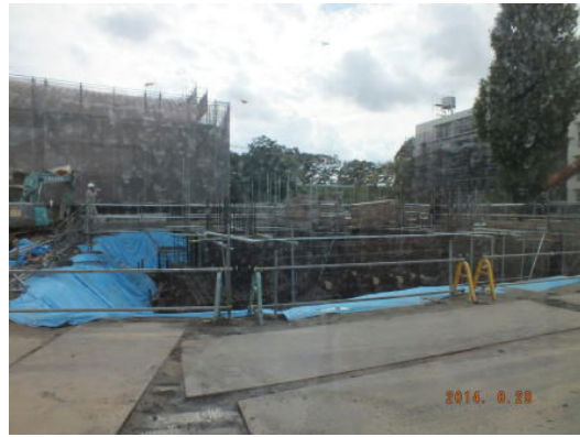
がっちり鉄筋が組まれています。地下が3m近く掘られました。