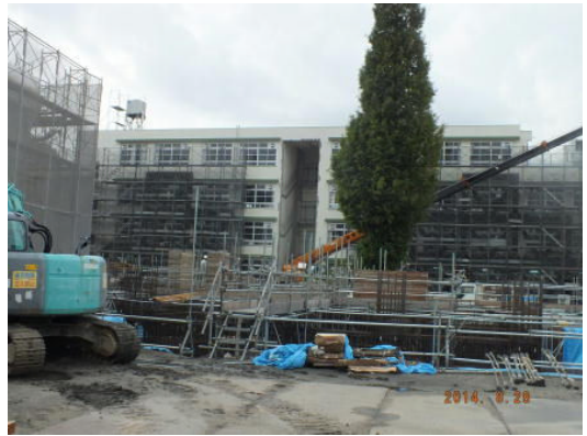
新校舎の土台づくりです。しっかりと鉄骨を組み、これからコンクリートを流して固めていきます。