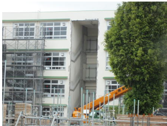
階段の部分がくり抜かれています。この部分は新校舎とドッキングします。

近隣の皆様には、暑いさなか、車両の通行や騒音等でたくさんご迷惑をおかけしました。まだまだ、工事は続きますが、今後とも、ご理解ご協力のほど、よろしくお願い申し上げます。