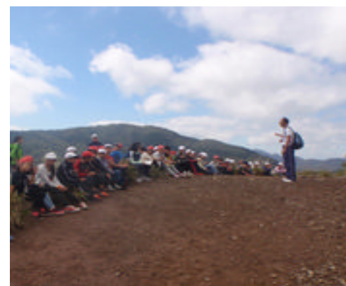
高丸山山頂到着！【3日目】