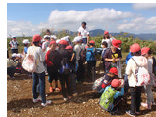
ゴミ拾い（山に恩返し）