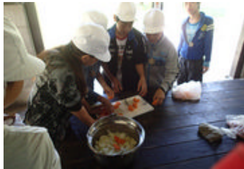
野外炊事（カレー作り）【4日目】