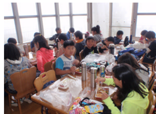
無事到着しました。【1日目のお昼のお弁当】