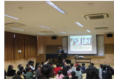
1年『情報モラル教室』

6年生は、税務署の方に来ていただいて、『租税教室』が行われました。税金の種類について知り、課税の割合について、クイズ形式の問題に取り組みました。税率という少し難しい課題でしたが、自分の意見をしっかりと発表していました。