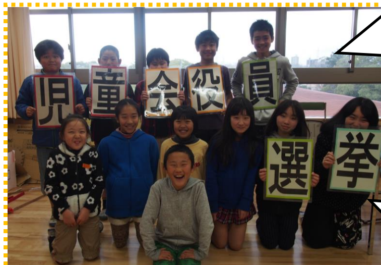
選挙管理委員のみなさん、本当におつかれさまでした!