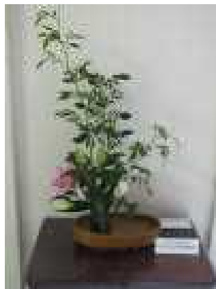
《ソケイ オリエンタルリリイ》

ありがとう、ありがたい、感謝、このような気持ちを育てる機会が学校にはいっぱいです。地域や保護者の方々を支えて頂いている子どもたちの様子をご覧に、いつでも学校にお寄りください。