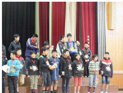
←見てください。6年生の胸には、手作りメダル!