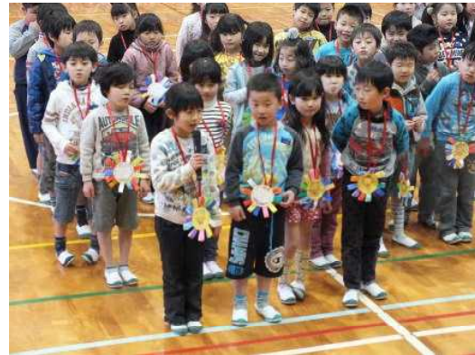
ありがとう 1年生の代表が、6年生に感謝の気持ちを述べています。この後、手作りのメダルを6年生に渡しました。→