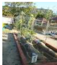
(さくら『とうもろこし』)