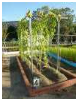
(4年『へちま・ゴーヤ』)