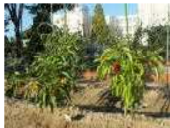
(さくら『カラーピーマン』)