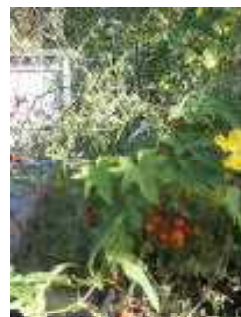
(飼育栽培委員会『ミニトマト』)