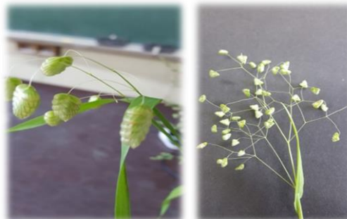
コバンソウ(イネ科) ヒメコバンソウ