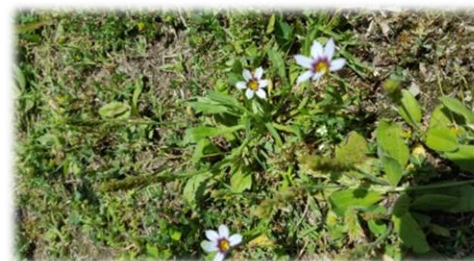
ニワゼキショウ(アヤメ科)

尼崎市内ではめったに見つけることが出来なくなった野草を、本校内で見つけることが出来ました。