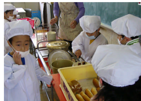
「初めての給食 (1年生)」