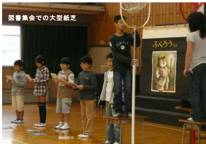
図書集会での大型紙芝居

とっても上手でした。みんなでかけ声をかけるなど工夫もあり、全校生が楽しく本の世界に引き込まれました。木曜にはすずらん会によるストーリーテリング(素話)。聴く態度がよかったとほめられました。金曜は図書委員が1～3年の教室を回って、自分たちで選んだ絵本の読み聞かせをしました。大きな声でゆっくりと、よく練習ができていたところは、低学年児童の目の輝きが違っていましたよ。