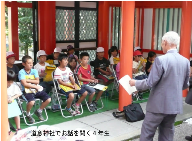
道意神社でお話を聞く4年生

10月18日(月)～20日(水)の3日間のオープンスクール、お忙しい中をご来校いただき、ありがとうございました。第1日目は「あまゆーず」のミニコンサートで、保護者や地域の方もいっしょに楽しいひとときを過ごしました。尼崎市の小中学校を卒業し、今も尼崎市在住の2人ということや、保育士の経験があってトークも上手で、子ども達の心をつかんで飽きさせない構成でした。おうちの方々も、応援よろしくお願いします。