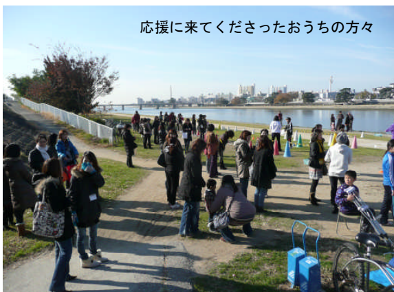
応援に来てくださったおうちの方々

豆移しとは、お椀に入っているダイズを箸で1粒ずつつまんで別のお椀に移すゲームです。タイムを決めて、移せたダイズの個数で勝負を決めます。私も手タレ（手専門のタレント）のように、紹介用のビデオ撮りのモデルをしましたが、乾燥しているダイズなので結構むずかしいですよ。豆移しと食育カルタの賞品は、な、なんと、「給食おかわり券」だそうです。がんばって！！