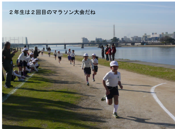
2年生は2回目のマラソン大会だね

今年は、育友会役員さんを中心に保護者の皆さんには、往復の道路交差点に黄色の腕章を付けて旗を持って立っていただきました。おかげさまで安全に行事を行えることができました。また、武庫川河川敷ではたくさんの保護者の方に応援していただき、子ども達の励みになりました。育友会からいただいた飴の甘さが保護者の皆さんの温かさのような気がしました。子ども達はおいしくいただきました。ありがとうございます。