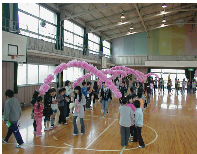
(6年生は花のアーチをくぐって退場)

最後になりましたが、保護者のみな様には、本校の教育推進にご協力・ご支援いただき、本当にありがとうございました。また、地域のみな様には、子ども達の下校時の安全見回りを始め、県民広場やたくさんのお祭りなど、子ども達を温かく見守っていただき、地域での居場所づくりにもご尽力いただき、感謝しております。ありがとうございました。