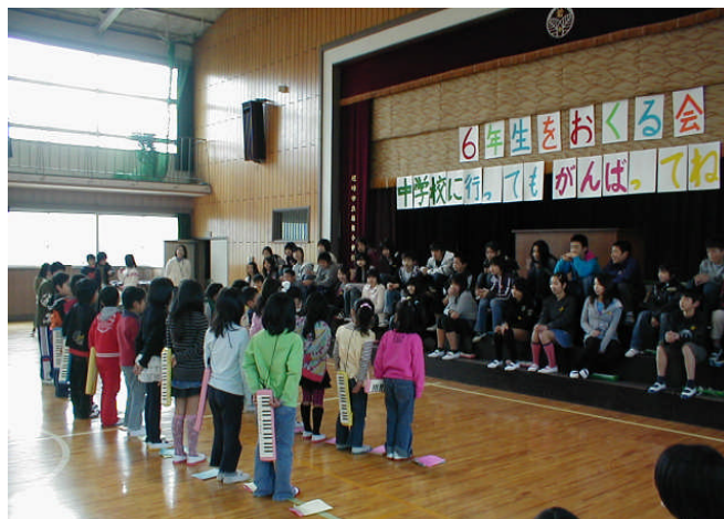
(6年生を送る会 みんなで思い出づくり)

保護者のみなさまも、一区切り。お疲れ様でした。でも、これから思春期を迎え多感な中学校生活が始まります。家族の「絆」でもって、優しく温かく支えてあげてください。