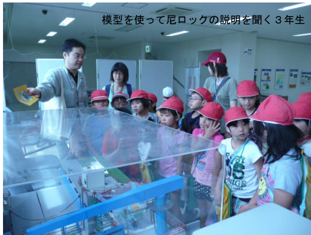
模型を使って尼ロックの説明を聞く3年生