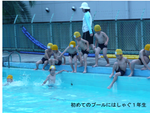
初めてのプールにはしゃぐ1年生

6月21日から始まった水泳も、気温が低くて中止の時もありましたが、子ども達は元気に短い夏のプールを楽しんでいます。低学年は水遊びを中心に、中学年は15メートルをめざして、高学年は25メートルをめざしていますが、個々の目標もあり、それぞれが自分のめあてを達成できるようにがんばっています。