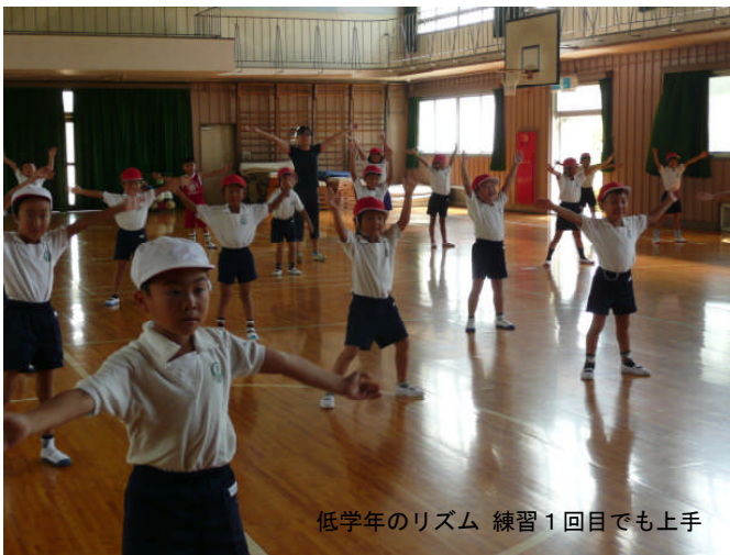
低学年のリズム 練習1回目でも上手

体育大会のリズム演技は、1・2年生が「Alright(オールライト)」ポップスロック調？とにかくハネて、担任曰く“カッコカワイイ(かっこいい+かわいい)”そうです。3・4年生は嵐の「Monster(モンスター)」Jポップ。マントをひるがえし、息を合わせて踊るそうです。5・6年生はもちろん組体操。「絆(きずな)」と題して、64人が一つになります。これからお家でも覚えたところを宿題で練習することもあると思います。低学年はうんと褒めて、やる気にさせてください。熱中症に気を付け、ケガの無いように注意してがんばりますので、応援よろしくをお願いします。