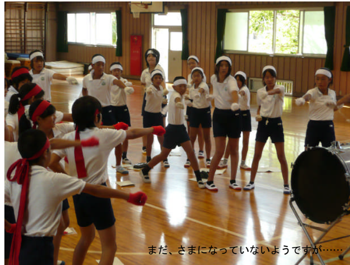
まだ、さまになっていないようですが……

体育大会の練習が13日(月)から始まりました。応援団は、一足先に8日(水)に結団式を行い、連日8時からの朝練をがんばっています。1日目は張り切って早く来ていたのですが、2日、3日と続くとだんだん登校が遅くなり、8時過ぎに体育館へ走る子どもの姿を目にします。先は長いので、目標に向かってがんばろうとする子ども達の力を信じ、モチベーションを下げないような指導者側の工夫でがんばりたいと思います。また、子ども達のモチベーションを持続するための大きな励みの一つがお家の方からの励ましの声かけです。いつもより少し早い登校となりますが、朝ご飯をしっかり食べさせ、一声かけて、気持ちよく家を送り出してあげてください。なんといいても、応援合戦は若葉小学校の体育大会の目玉の一つですから……。