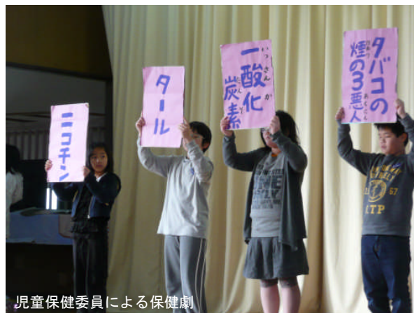
児童保健委員による保健劇

若葉小学校女子は、初めは大庄小がリードしていた得点を中盤に若葉小が追い上げ、追い越しました。最後は4クォーター残り数秒時点で、若葉小30対大庄小29。終了を告げるホイッスルが鳴る直前に、大庄小の放ったシュートがホイッスル後にゴールイン。この1ゴールが相手チームの得点となり、若葉小30対大庄小31で、大庄小の勝利。負けたけれども、賞賛の嵐、みんなの記憶に残るドラマのようなすばらしい戦いを見せてくれました。男子は、第1回戦を成徳小学校との拮抗した戦いを制し、勝利！ 続く成文小学校との第2回戦は、女子の大応援の甲斐無く、勝つことはできませんでしたが、大庄地区第3位というすばらしい結果を残すことができました。結果だけではなく、一人一人のがんばりがよく分かる本当にいい試合でした。