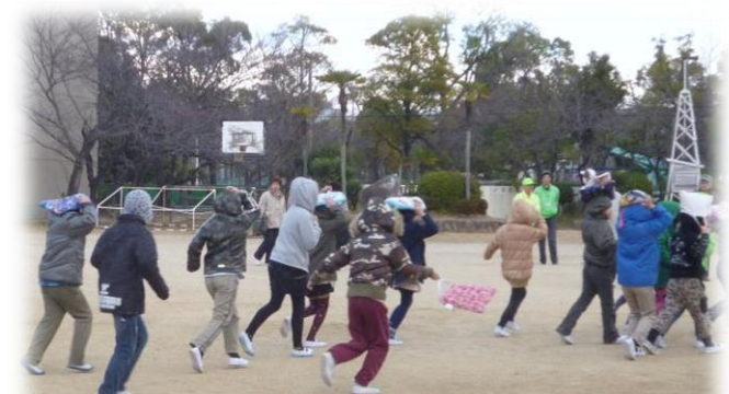
「1.17は忘れない」地域防災・引き渡し訓練 H26. 1. 17 94世帯(87%)の保護者の皆様や、10数名の地域の皆様に参加いただきました。ご協力ありがとうございました。

さて、季節の分かれ目を意味する『節分』には、豆まきをする風習がありますが、一説によれば豆という字は『魔滅』に通じ、鬼にぶつけることにより、邪気（鬼）を追い払って、新しい季節を迎えるという意味があるそうです。「めんどくさい」とか「なまけたい」なんていう、自分の心の中の邪気（鬼）も、豆まきの「鬼は外」の掛け声と一緒に追い払い、春の始まりに合わせて、心も新たにスタートしてほしいと思います。