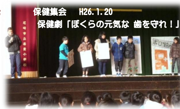
保健集会 H26. 1. 20 保健劇「ぼくらの元気な歯を守れ！」