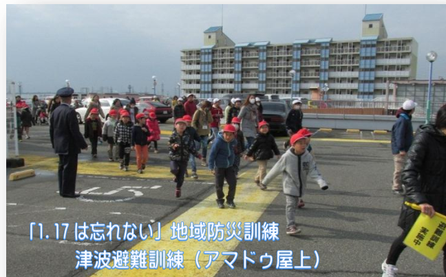
『1.17は忘れない』地域防災訓練 津波避難訓練（アマドウ屋上）

東日本大震災では、児童生徒の活躍によって多くの人命が助けられた事例がありました。「幼い頃から家庭や地域で、学校へ行くようになってからは学校でも、防災を学んできた。だから震災の時、自然と行動できた。」という当時の生徒の言葉からも、近い将来、確実に発生すると言われている大地震に備え、学校・家庭・地域が連携して防災教育を推進していくことの重要性をあらためて感じています。