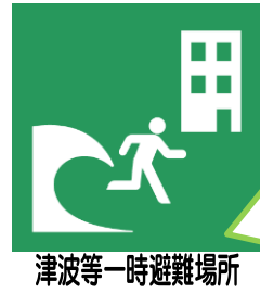
津波等一時避難場所

平成26年12月現在、尼崎市の津波等一時避難場所の設置状況は、311施設（258,110人）です。 詳しくは、尼崎市のホームページをご覧ください。