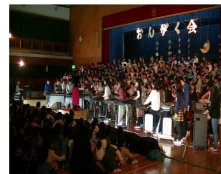
音楽会ではご来校ありがとうございます。