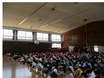
静かに集まっています