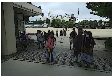
登校時の朝のあいさつ