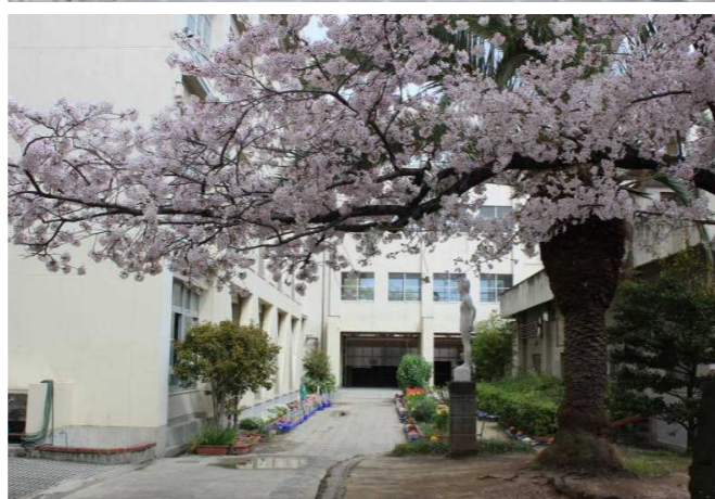
4月4日撮影 子ども達が校内に戻ってくるのを待ちわびるように桜が満開です。