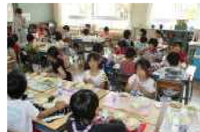
4月25日 1年生初めての給食…ハヤシライスおいしいなあ！