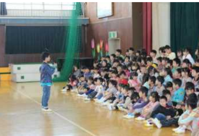
4月19日 1年生を迎える会です。みんなでお祝いしました。