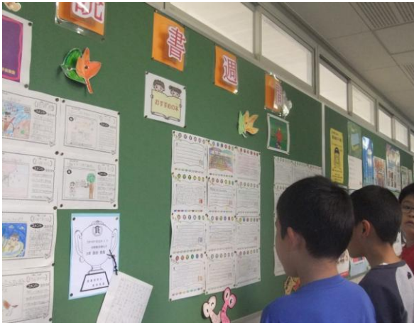
【写真1】 読書にちなんだ掲示が たくさんされています。