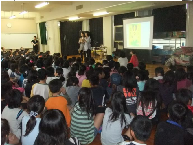
思わず聞き入ってしまいました。