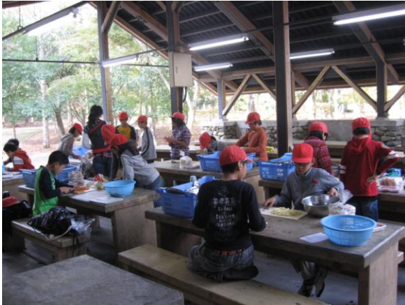
野外炊事。みんなで協力して おいしいカレーうどんができました。