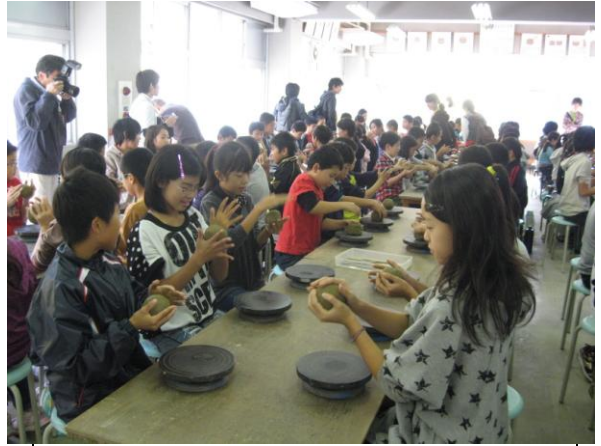
立杭焼。完成が楽しみです。