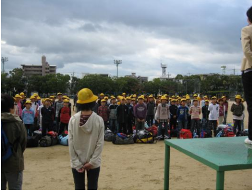
出発式。荷物が重そう。