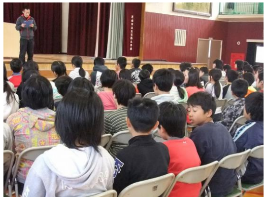
学校もすっかり春じたく。卒業式の練習にも気合いが入っています。