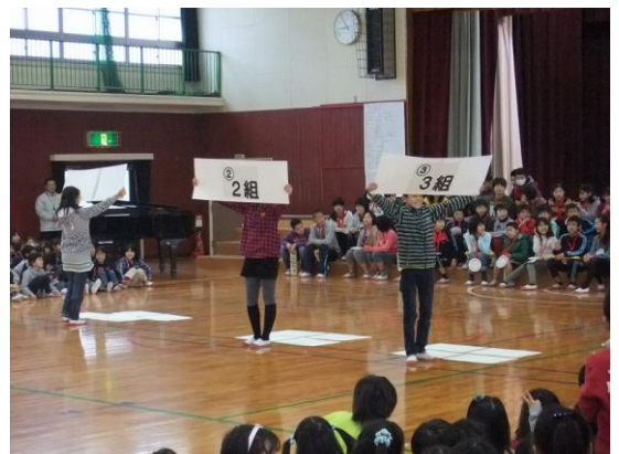
6年生を送る会の様子（3月1日）