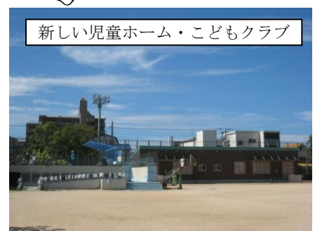
新しい児童ホーム・こどもクラブ