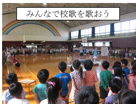
みんなで校歌を歌おう