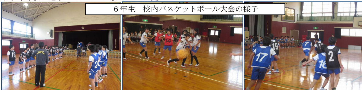
6年生 校内バスケットボール大会の様子

また、6年生には卒業までの思い出づくりの一環とキャリア教育の観点から、グループ毎に給食を校長室で一緒に食べる日を毎年設定しています。今年は2月15日から3月8日までの間で、各クラスを5グループに分けて順番に校長室に招待します。わずか30分程度の短い時間ですが、一人ひとり自己紹介してもらって、自分のよいところや得意なこと、将来の夢などを語ってもらいます。国際的な調査（「国立青少年教育振興機構の高校生国際比較調査」）では、日本、アメリカ、中国、韓国の高校生の中で、日本の高校生の自己肯定感が最も低いという結果が出ています。日本人の奥ゆかしさを差し引いたとしても、もっと自分のよいところを自覚し、自信をもって行動したり、アピールしたりできるようにしていかなければならないと思います。立西っ子たちには、自分のよいところをしっかりと認識して、自信を持ってこの春、中学校に進学してほしいと願っています。