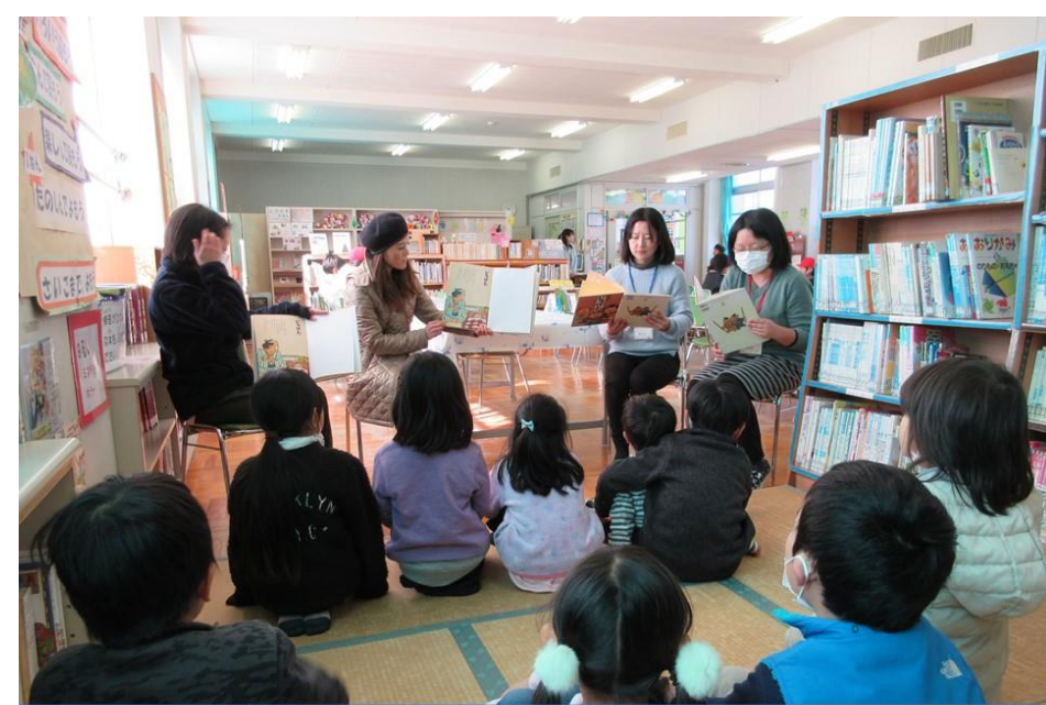
4 お世話になっているボランティアの方々