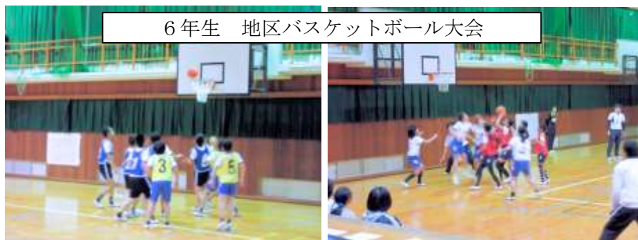
6年生 地区バスケットボール大会

子どもたちの可能性は無限です。スポーツでも音楽でも、またその他のカテゴリーにおいても、自分で気づいていない秘めた力が備わっているかもしれません。それを見つけ、伸ばしてあげることが学校教育の役目の一つでしょう。今年は「ブレイクスルー イヤー」として、どんどん新しいことに挑戦し、躍進してほしいと思います。