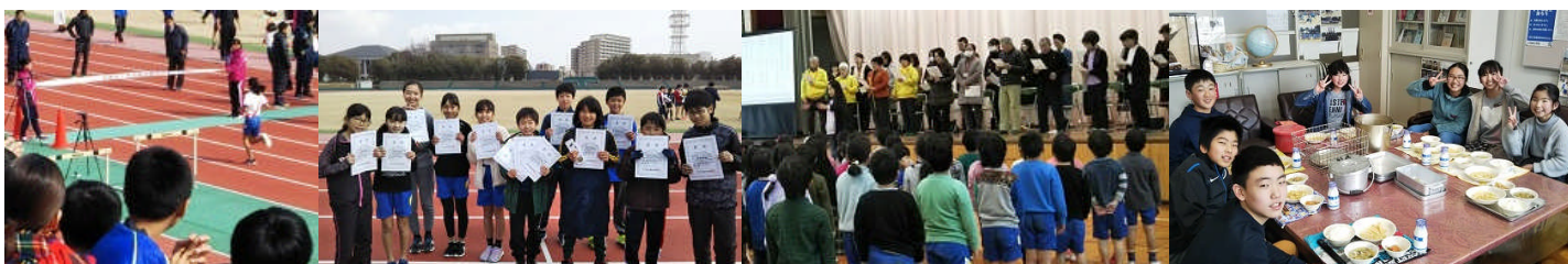
<6年生 校長室ランチ>