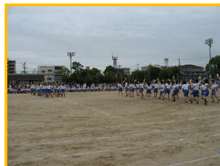
【4年生 いざ進めよ、心向く方角に】