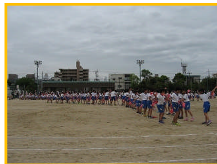
【3年生 咲かせよう！八十八の華】