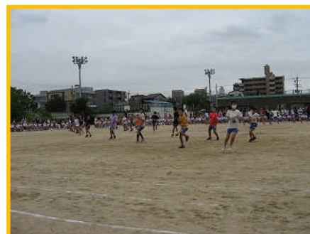
【6年生 すべて越えてとどけ-手話UDダンス】