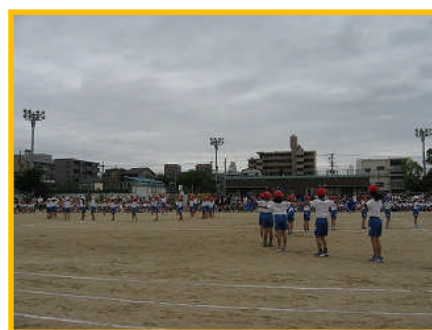
【2年生 世界を救う 立西インベーダー】