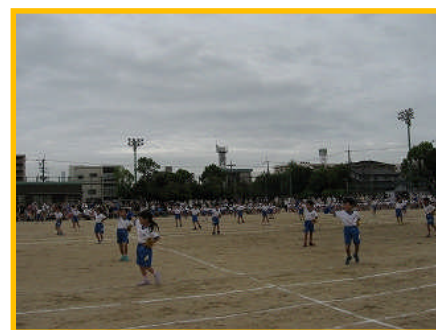
【1年生 はりきり1年生】

今年度は、観覧にあたって、保護者や地域の皆様に多くのお願いをしておりました。当日は、皆様にマナーを守って観覧いただいたおかげさまをもちまして、スムーズに体育大会を運営することができました。子どもたちの頑張る姿をご覧いただけて本当に良かったです。ご協力ありがとうございました！ 今後も、引き続き様々な面でご協力をお願いすることもあると思いますが、どうぞよろしくお願いいたします。