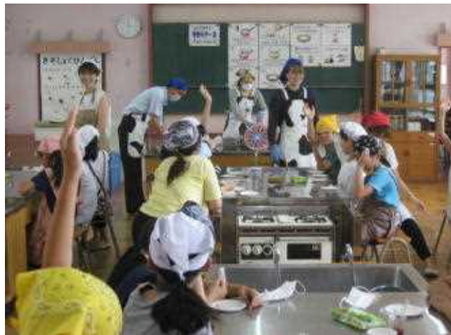
出前授業（チーズづくり・5年生）