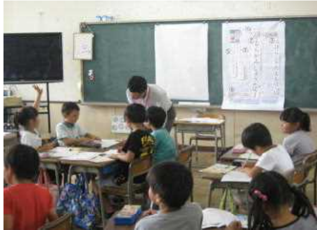
出前授業（手紙の書き方・2年生）