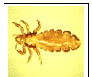
★長径 2～4 mm