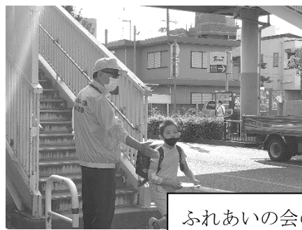
ふれあいの会の方

昨年より引き続き、登校時の見守りにご協力いただいている方々がいらっしゃいます。地域の方、愛護部の担当の方など、それぞれの場所で登校時に危険がないか、安全に登校できているか見守っていただいています。子どもたちは、その方々に感謝の気持ちをもって「おはようございます。」と挨拶できているのでしょうか？「自分からあいさつしよう。」と朝会で話をしたところ、声に出してあいさつする子が増えてきたようにも感じます。毎日見守っていただいていることは当たり前ではありません。「子どもたちのために」と協力いただいている方ばかりです。気持ちのよい挨拶で、その方々に感謝の気持ちを伝えられたらいいですね。ご家庭でもお声掛けしていただけたらと思います。