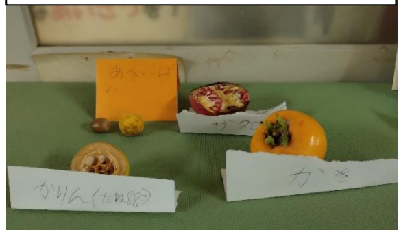
秋がいっぱい（校内で採れた実たち）

図書ボランティアさんが季節の飾りつけをしてくださっています。図書室前は、とてもわくわくする気持ちになります。